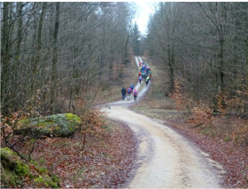
Vorbei an dem Weiler Gibacht mit seinen gepflegten Gärten und der kleinen Kapelle